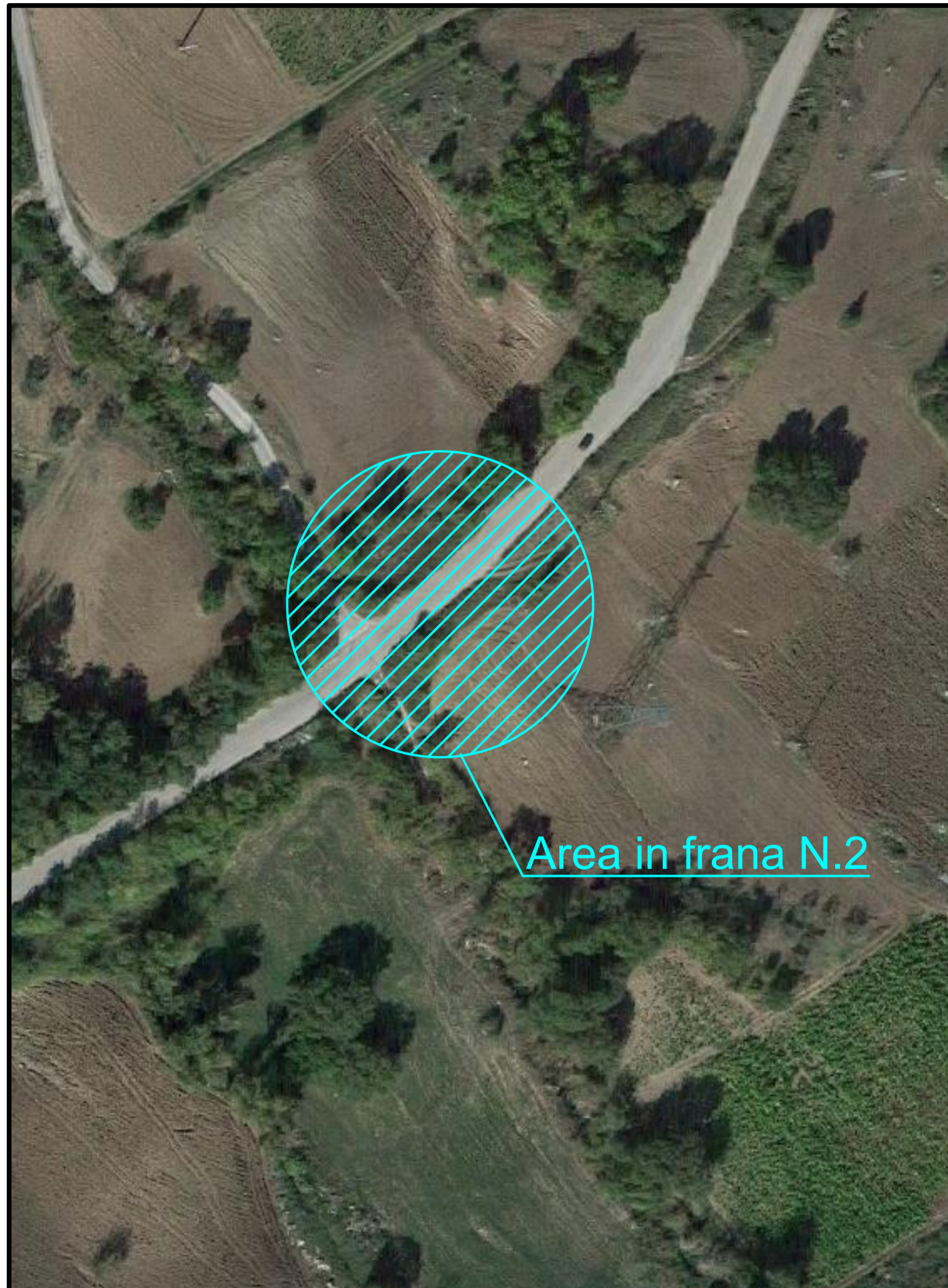
Area in frana N.2